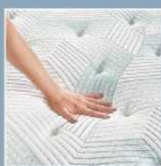
CoolTemp Technology 冷凝涼爽科技