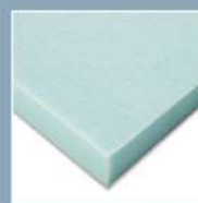
Surface Gel Technology Foam™ 涼感高科技泡綿